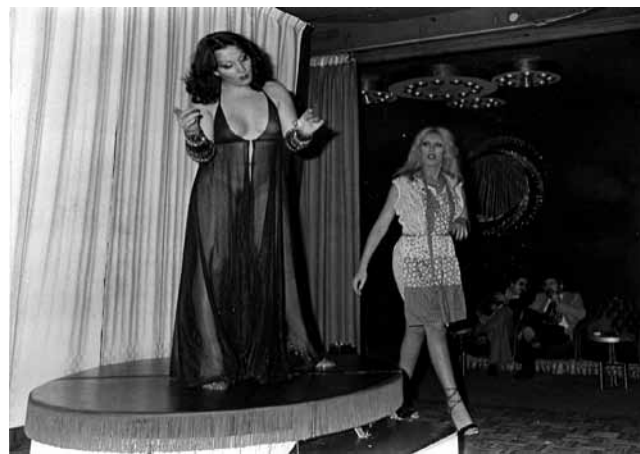
Una transexual actuando en el Bagdad en los años 80

Cierto que, en todos esos años, incluso dentro del régimen fascista había cambiado la visión del mundo, e incluso del mundo gay. De las palizas, las torturas, los electrochoques de los primeros años se había pasado a la privación de libertad sin castigos corporales, igual