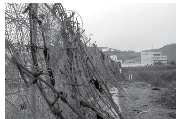
Valla de Ceuta

Somos un Comité Promotor en el que participan migrantes, sus organizaciones y aliados, académicos, defensores de los derechos humanos y organizaciones que ejercen el derecho y servicio de brindar hospitalidad a los migrantes que transitan o viven en nuestros países. Consideramos imprescindible que la palabra de los protagonistas de la migración, el desplazamiento humano y el asilo por motivos políticos, sociales, culturales, económicos, sexoafectivos o medioambientales, sea escuchada por contraposición a la agenda