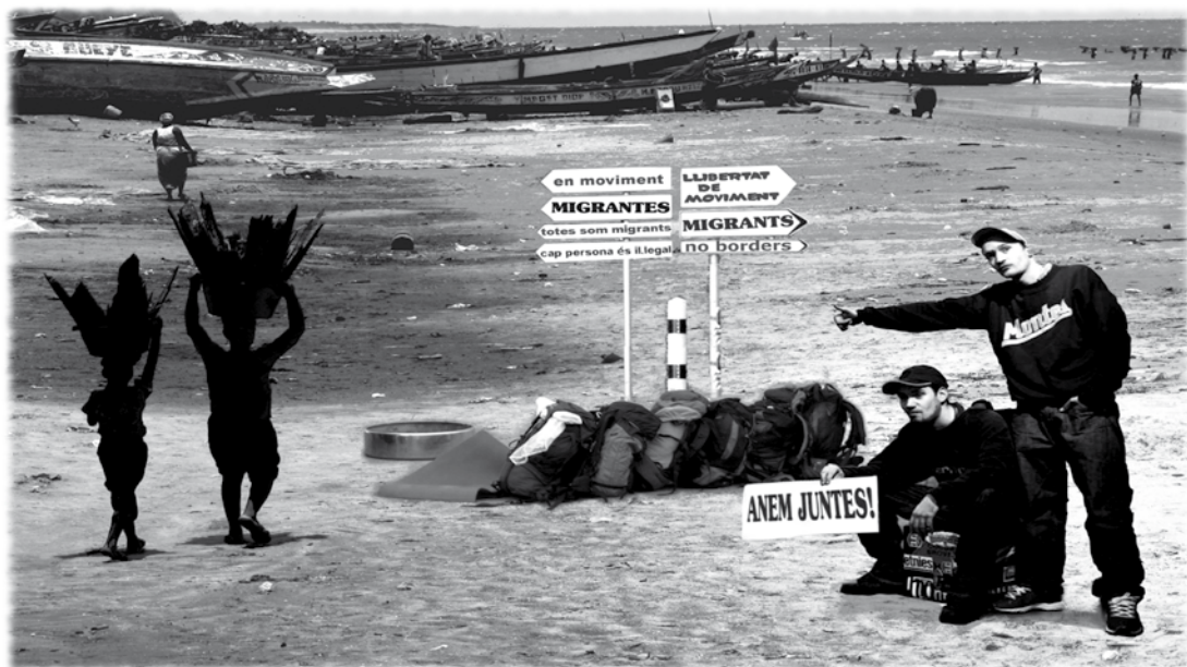
Ilustración / Leo

Tal vez el otro término que más me chirría es "persona inmigrada". Para explicar por qué prefiero seguir usando la palabra "migrante", basta recordar a Cela, cuando puntualizó que él no estaba "dormido" sino "durmiendo": "no es lo mismo estar jodido que estar jodiendo". El participio me resulta incómodo, básicamente porque se refiere a un colectivo al que