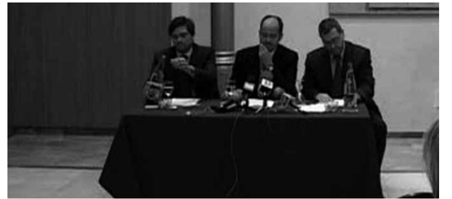
Según el proceso judicial en marcha algunos asociados de APARTUR habrían legalizado apartamentos a través de Lozano. En la imagen, rueda de prensa de la asociación en 2007

APARTUR Associació d'Apartaments Turístics de Barcelona