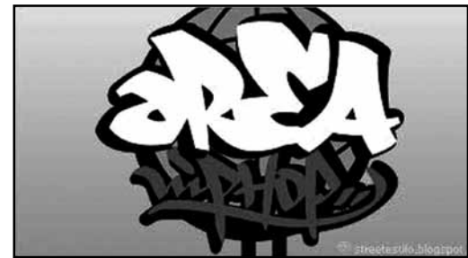
Programa de radio y webs difusoras de la música hip hop

De sobras es conocida la influencia de programas de radio en la formación y educación musical de futuras generaciones de raperos, DJs y productores