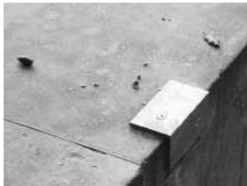
Pig ear antiskater

Els centres comercials semblen haver-se convertit en el patró per a la modificació de l'espai públic de les nostres ciutats. S'assemblen a la ciutat, tenen carrers, places, però realment no ho són. Representen tan sols una simulació d'un ambient urbà, una cosa molt característica d'una època, la nostra, que sembla preferir sempre més la simulació a la realitat